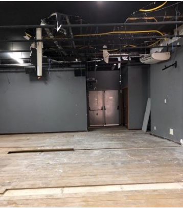
17.3. Sala Multiuso