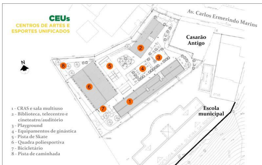
Figura 1: Planta baixa do CEU de Jurujuba/Niterói

OBS.: Na legenda da figura, onde está indicado 1 - CRAS e sala multiuso - leia-se "Biblioteca, telecentro e cineteatro/auditório", e onde está indicado 2 - Biblioteca, telecentro e cineteatro/auditório - leia-se "CRAS e sala multiuso". Na planta, correspondência numérica dos espaços mencionados está trocada.